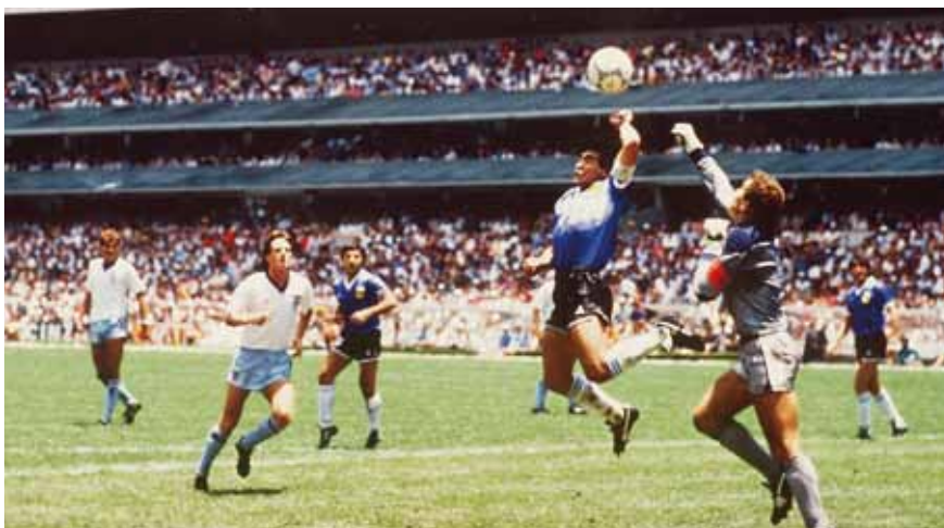
Im Viertelfinale der Fußball-Weltmeisterschaft in Mexiko trafen am 22. Juni 1986 England und Argentinien aufeinander. Dabei erzielte der argentinische Mannschaftskapitän Diego Maradona in der 51. Spielminute mit der Hand ein irreguläres Tor. Maradona zeigte nach dem Spiel keine Reue und sagte vor laufenden Kameras: „Es war ein bisschen die Hand Gottes und ein bisschen Maradonas Kopf“. Erst im Jahr 2005 gab Maradona zu, den Ball mit der Hand gespielt zu haben. 2008 entschuldigte er sich dafür.

Dem früheren Bundestrainer Sepp Herberger gelang es, fast schon weise Sätze zu formulieren, die elementare Lebenserfahrungen aufnehmen: „Das Spiel dauert neunzig Minuten.“ – „Der Ball ist rund.“ Man kann den Ball also rollen lassen, vieles ist dann möglich. Aber nichts ist sicher. Fußball als „Spiel des Lebens“? Verlieren oder gewinnen, sei es im Fußballstadion oder im Alltag, kann zur religiösen Erfahrung werden, wenn Menschen davon im Tiefsten ihrer Existenz berührt werden. Doch selbst wenn sich dem Menschen auch am Fußball Transzendenzerfahrungen erschließen sollten, so bleiben doch Fragen offen: Wird Gott dann einfach als göttliche Macht verstanden, die nur