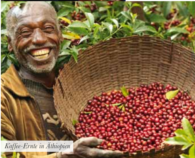
Kaffee-Ernte in Äthiopien

Je mehr Menschen sich mit dem Thema fairer Handel auseinandersetzen, umso größer wird auch die Zielgruppe, die der Weltladen anspricht. Moderner, klarer strukturiert als in der Anfangszeit prä-