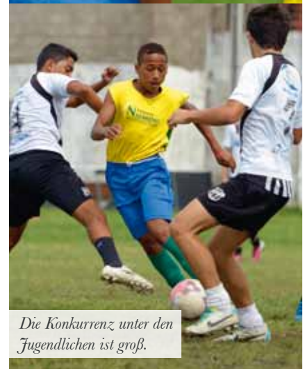
Die Konkurrenz unter den Jugendlichen ist groß.