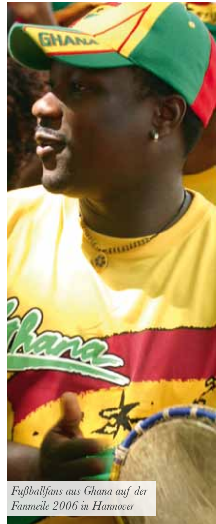
Fußballfans aus Ghana auf der Fanmeile 2006 in Hannover

Der Abdruck des Interviews erfolgt mit freundlicher Genehmigung von „reformiert“, der Mitgliederzeitung der Evangelisch-reformierten Kirche.