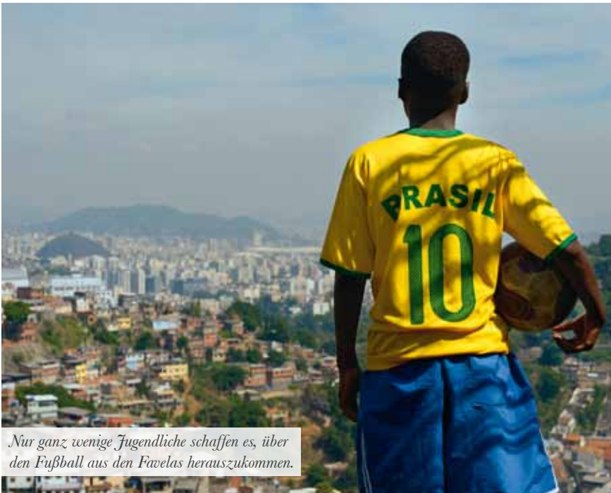
Nur ganz wenige Jugendliche schaffen es, über den Fußball aus den Favelas herauszukommen.